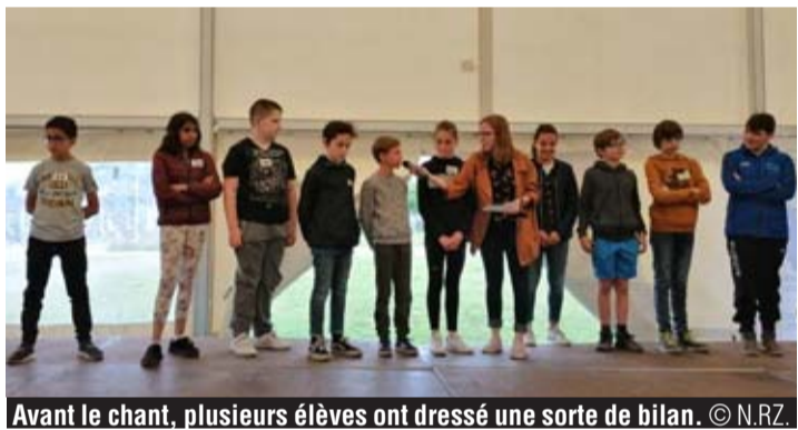
Avant le chant, plusieurs élèves ont dressé une sorte de bilan.