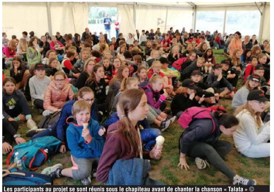
Les participants au projet se sont réunis sous le chapiteau avant de chanter la chanson « Talata »