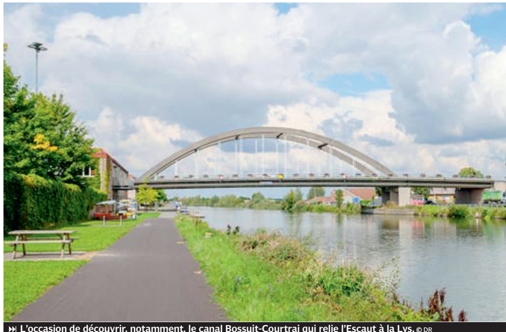
» L'occasion de découvrir, notamment, le canal Bossuît-Courtrai qui relie l'Escaut à la Lys.